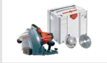
MF 26 cc GF-MAX